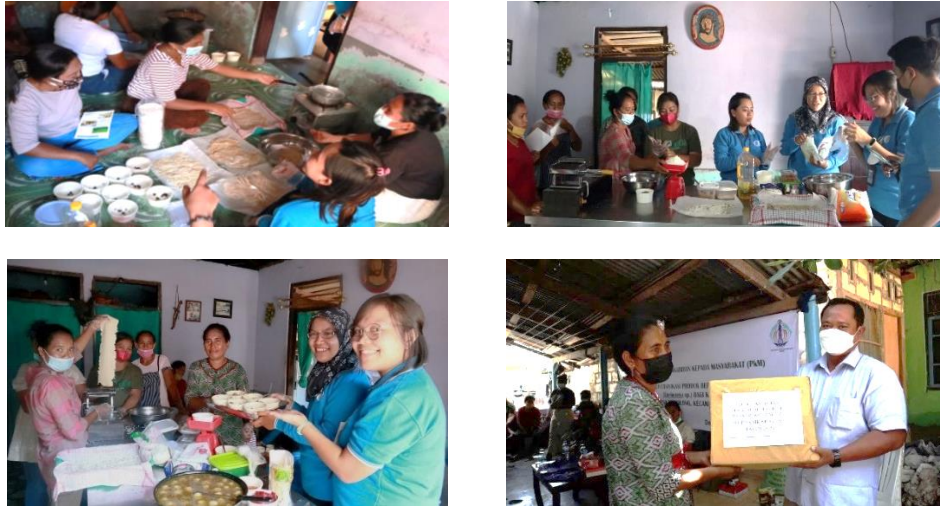
Gambar 3. Pembuatan produk olahan rumput laut (mie, dodol, biskuit) dan Pemberian bantuan bahan pengabdian kepada masyarakat di desa Tablong

Setelah proses pembuatan bahan produk olahan dilakukan kemudian dilanjutkan pemberian bantuan bahan produk olahan kepada masyarakat. Kegiatan pembuatan produk olahan rumput laut dan pemberian bantuan bahan kepada masyarakat disajikan pada Gambar 3.