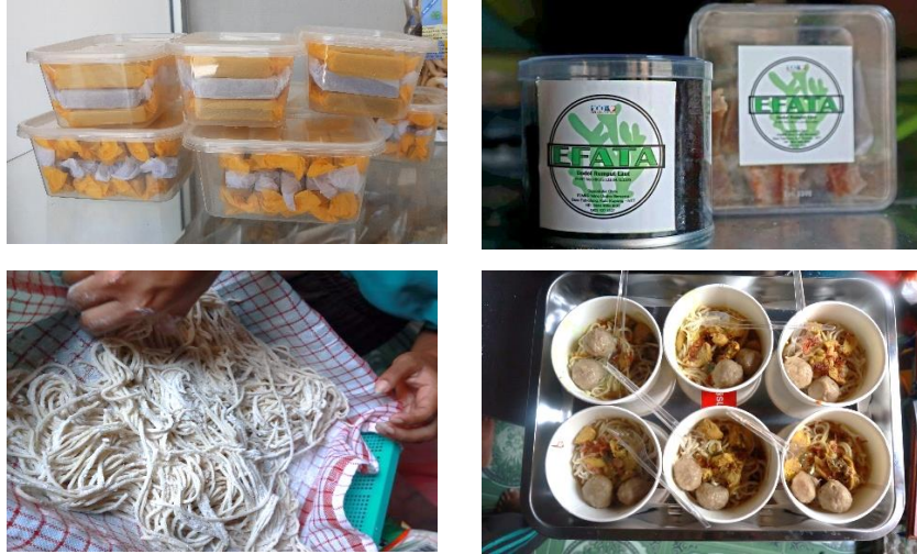
Gambar 7. Diversifikasi produk rumput laut di Desa Tablolong

masyarakat guna meningkatkan nilai produk lokal. Selain itu, kolaborasi antara akademisi, pemerintah desa, dan masyarakat juga menjadi faktor penting dalam keberhasilan program ini, di mana sinergi berbagai pihak dapat mendorong keberlanjutan kegiatan pengabdian (Teurupun et al., 2013). Untuk hasil diversifikasi produk rumput laut yang telah dilakukan oleh masyarakat di desa Tablolong disajikan pada Gambar 7.