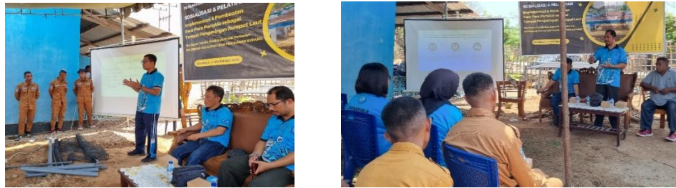
Gambar 4. Sosialisasi terkait teknik penjemuran yang higienis di desa Tesabela

laut yang dijemur. Sosialisasi dilakukan melalui pertemuan dengan kelompok masyarakat, perangkat desa, serta tokoh masyarakat setempat. Kegiatan sosialisasi terhadap masyarakat di Desa Tesabela disajikan pada Gambar 4.