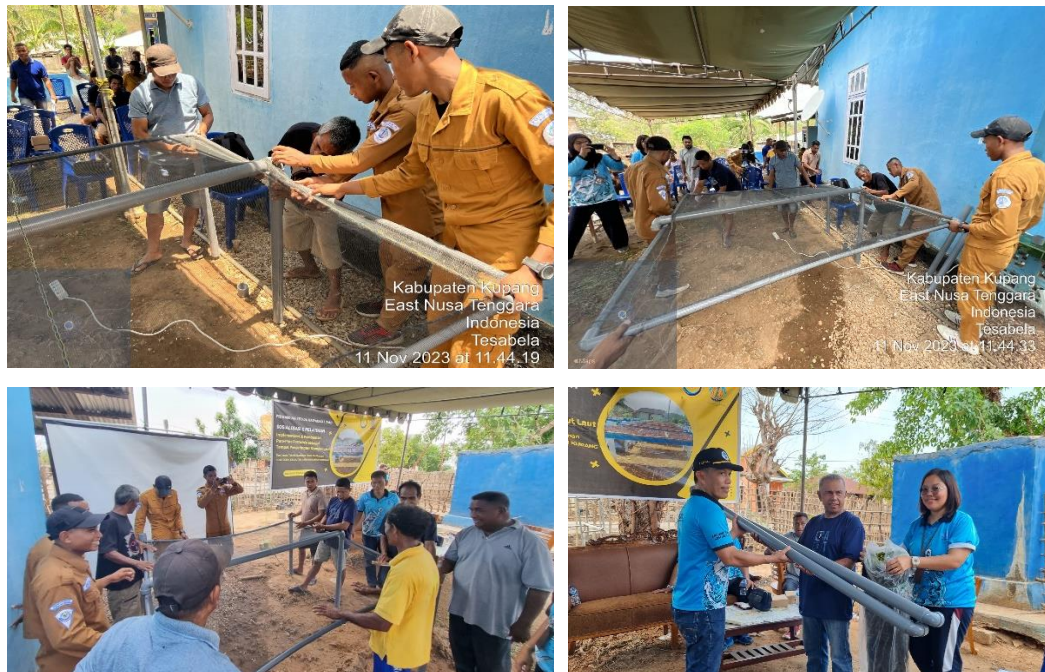
Gambar 5. Pembuatan para-para portable rumput laut dan Pemberian bantuan bahan pengabdian kepada masyarakat di desa Tesabela