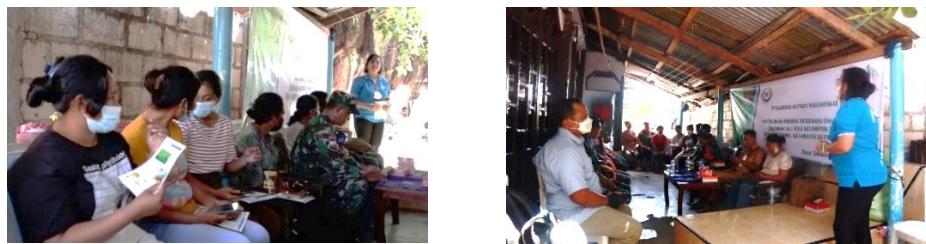
Gambar 2. Sosialisasi terkait diversifikasi produk rumput laut di desa Tablolong