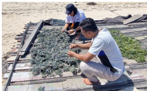
Gambar 1. Penjemuran rumput laut dengan konvensional

Desa Tesabela merupakan salah satu Desa penghasil rumput laut kering di Kabupaten Kupang. Metode yang digunakan dalam proses pengeringan rumput laut masih secara tradisional, yaitu menggunakan bantuan sinar matahari. Akan tetapi, sebagian besar pembudidaya rumput laut masih menggunakan metode pengeringan di atas terpal plastik atau waring dengan menggelarnya di atas tanah, karang atau pasir yang tersajikan seperti pada Gambar 1. Walaupun metode ini memiliki fleksibilitas tinggi dan bersifat mobile (mudah dipindah-pindah) sesuai arah sinar matahari, namun berisiko terjadi kontaminasi oleh debu, pasir atau kotoran lainnya, dan kandungan air yang tinggi serta tidak merata, selanjutnya waktu penjemuran yang lama dapat mempengaruhi pertumbuhan mikro organisme seperti kapang dan jamur kondisi berdampak pada mutu rumput laut menjadi lebih rendah (Hikmah, 2015; Jamal, 2016; Risal, 2017; AR et al. 2019; Suciyati, 2019).